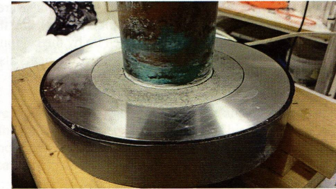
Figure 2-1. Left: copper heater and steel bottom plate. The plastic filter (white) is visible at the bottom of the groove. The outer diameter of this groove is 18.2 cm, and the inner diameter is 10.8 cm. Right: bentonite ring emplaced.