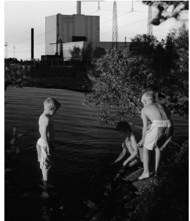
Fotomontage Kenneth Gunnarsson