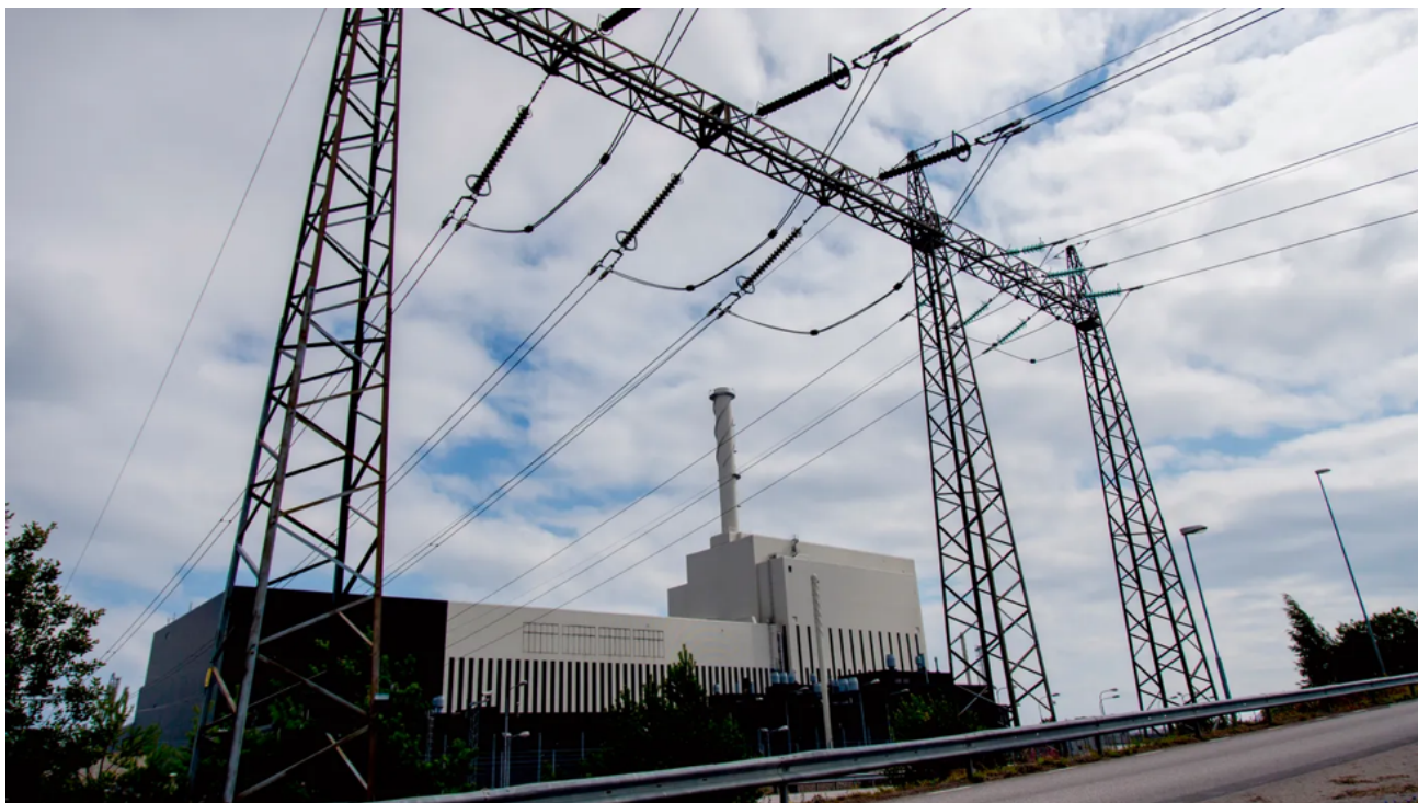
O3-reaktorn i Oskarshamns kärnkraftverk.