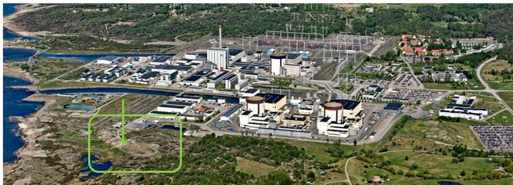
Figur 1 Ringhals markförvar

Markförvaret är beläget i sydvästra delen av Ringhals industriområde, se figur 1. Området är enligt gällande detaljplan avsett för storindustri. Den ökade volymen erhålls genom att förvaret byggs ut i dess norra ände, markerat med en pil i figur 1. Förvaret ligger inom Ringhals industriområde utan tillträde för allmänheten.