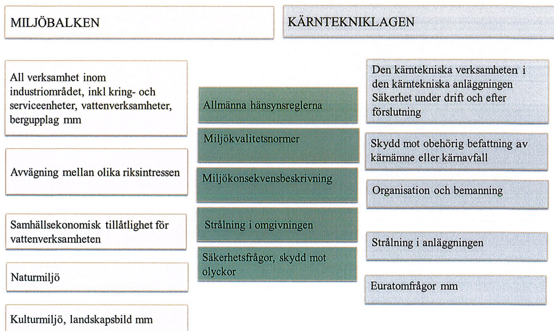
Figur 1 - Omfattningen av prövningarna enligt MB respektive KTL

Prövningarna enligt KTL och MB är delvis överlappande, dvs. vissa sakfrågor ska granskas och bedömas vid båda prövningarna. I Figur 1 har överlappande sakfrågor markerats med grön färg.