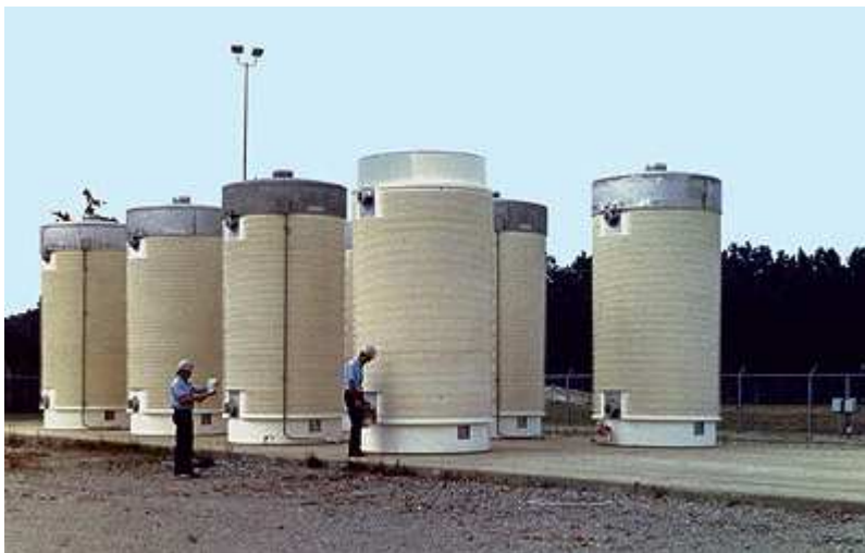
Vertical casks being monitored

Since the first casks were loaded in 1986, dry storage has released no radiation that affected the public or contaminated the environment. There have been no known or suspected attempts to sabotage cask storage facilities. Tests on spent fuel and cask components after years in dry storage confirm that the systems are providing safe and secure storage. NRC also analyzed the risks from loading and storing spent fuel in dry casks. That study found the potential health risks are very small.