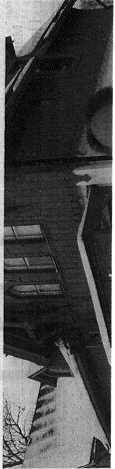
Besöks. Eric Wall och