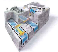
Utbyggt Clab 2008