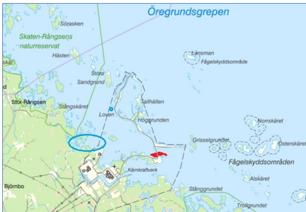
Figur 1. Provfiskestationer i Forsmarks skärgård som användes för att beräkna yngeltätheten. Områden för yngelprovfiske (detonationsfiske) är markerade med blå cirklar. Området berört av utfyllnad är markerat i rött.