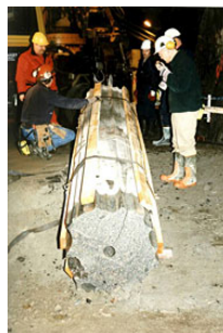
Nyss upptaget Lotpaket.