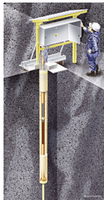
Lotförsöket består av paket med kopparrör omgivna av block av bentonitlera. Illustration: Jan Rojmar

Den andra hälften av paketet utsätts för normala förhållanden (90°C). De paket som utsätts