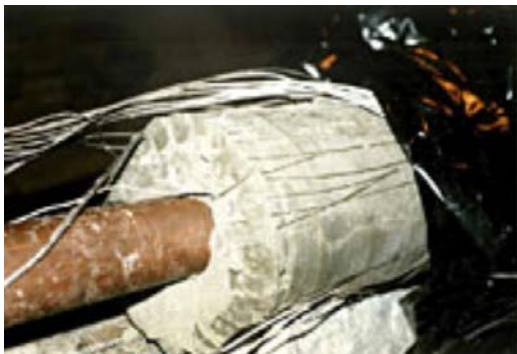
Figur 1. Bild på den svalare delen av kopparröret från ett LOT-försökspaket

Den enda bild som offentliggjorts av ett upptaget centrälrör publicerades 2009 på kärnavfallsbolagets hemsida. En nersparad version av sidan finns som bilaga 1 och bilden finns dessutom som figur 1 nedan. Det är oklart om det är röret från femårspaketet A2 som visas i bilden eller om det är ett ettårspaket. Hur som helst är bilden från den svala delen av röret nära toppen och inte från den mest upphettade delen där den största korrosionen skett.