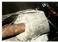
Kopparrören i Lotpaketen är till-verkade i en annan kopparkvalitet än kapseln det går därför inte att dra några slutsatser om korrosion utifrån dessa.