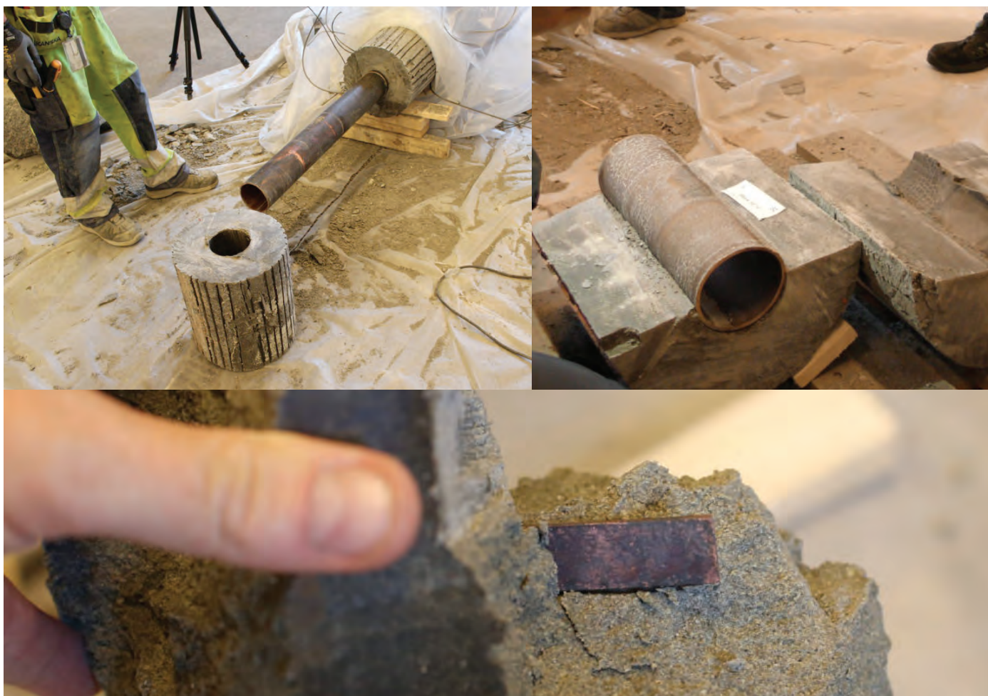
LOT-paketerna upptagna i Äspölaboratoriet upptagna utan insyn – avsågat under möte.