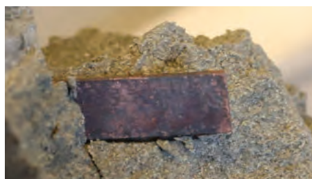
Kopparkupong från LOT-försök

Det finns tydliga brister i det vetenskapliga underlaget för kärnavfallsbolagets ansökan om att få uppföra kärnbränsleförvaret. Det blev extra tydligt när mark- och miljödomstolen i januari 2018 lämnade sitt yttrande till regeringen och sa att frågan om hur snabbt koppar korroderar i den tänkta kärnbränsleförvaringsmiljön inte var löst.