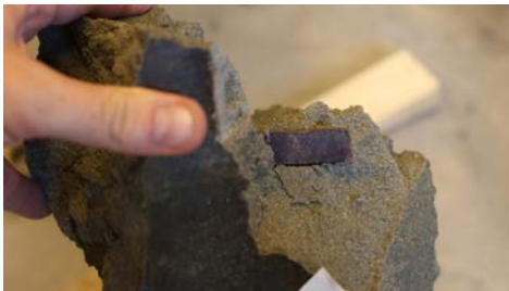
Kopparprov som legat i bentonitleran i 20 år.