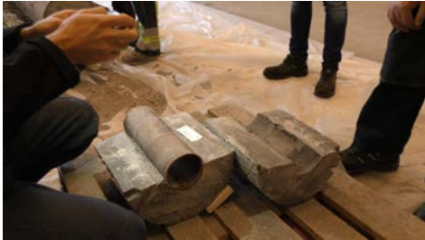
Dokumentation av prover från det andra paketet som togs upp.