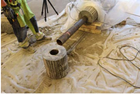
Bentonitsegment taget från det första paketet som togs upp.